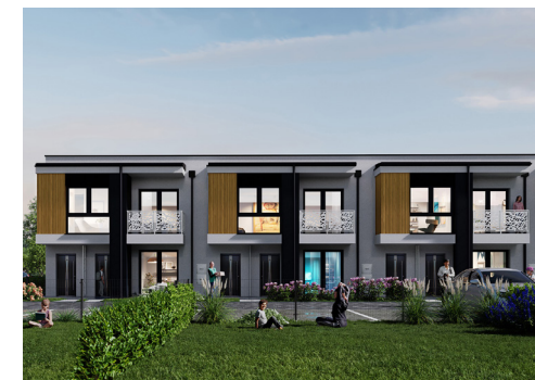
Widok od strony wejścia