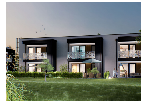
Widok od strony ogródków