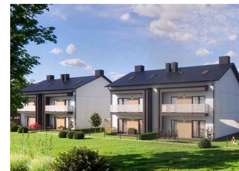
Widok od strony ogródków