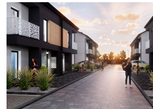
Widok od strony wejścia