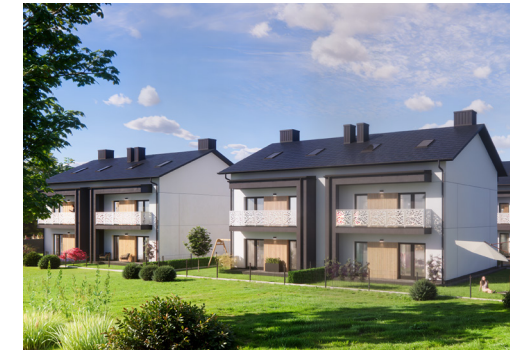
Widok od strony ogródków