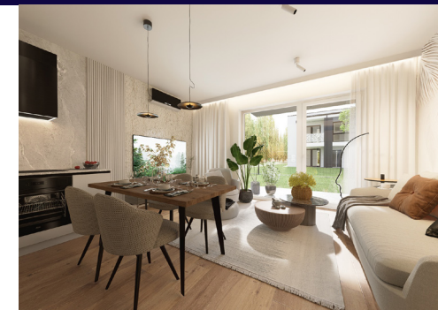
Przykładowa aranżacja wnętrza