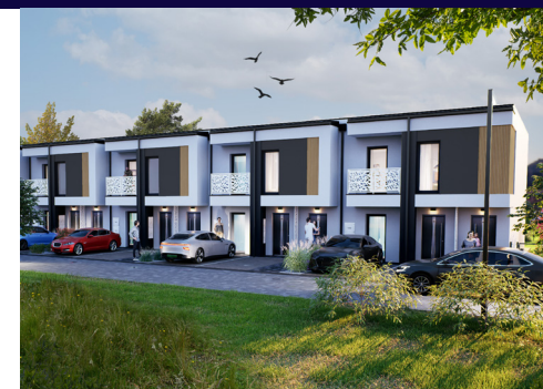
Widok od strony wejścia