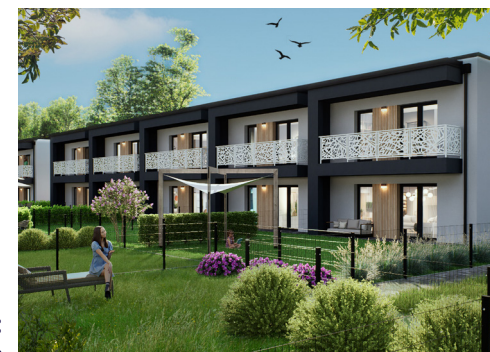
Widok od strony ogródków