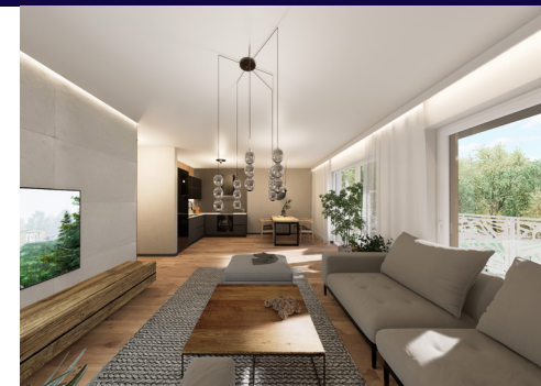
Przykładowa aranżacja wnetrz