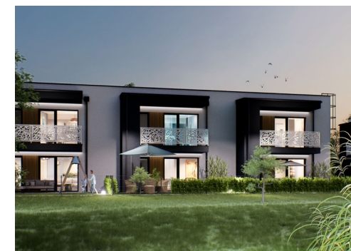
Widok od strony ogródków