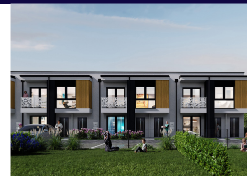
Widok od strony wejścia